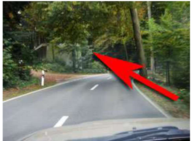
Von Uster etwa nach 500 Metern rechts und von Freudwil links (gleich Anfangs Wald) ist ein Munitionsbunker