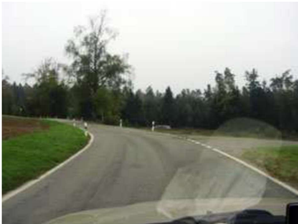
Von Fehraltorf durch Freudwil Richtung Uster

Wenn du von Fehraltorf kommst, fahre über die Usterstrasse über den Bahnübergang Richtung Freudwil.